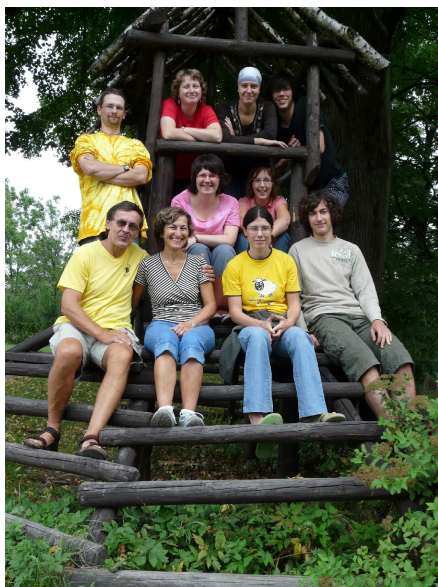
Vedoucí na táboře Dětské misie ve Frenštátě

v době našeho zamýšlení nad tím, co jsme společně prožili v druhé polovině roku 2009, jsou před námi jeho poslední dny. Čas adventu (z latiny adventus = příchod ) je nejen začátkem liturgického roku, ale i začátkem příprav na Vánoce. Pro nás křesťany to je dvojitý očekávání, narození Ježíše Krista a Jeho druhého příchodu na konci tohoto času. Adventem i v našem rodinném životě je to, že jsme se od prázdnin oba připojili k týmu Dětské misie. A tak tady máte náš první společný dopis shrnující to nejpodstatnější, co se událo.