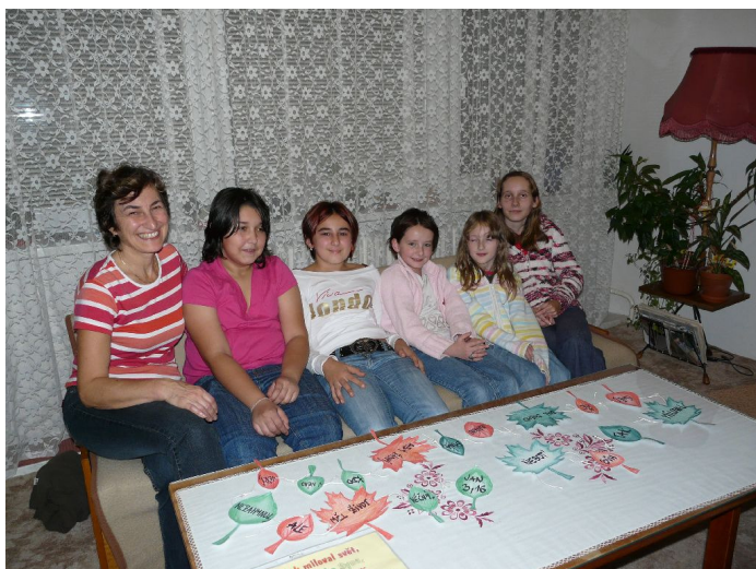
První podzimní setkání v klubu

Náš Klub dobré naděje oslaví zanedlouho osmnáctiny!