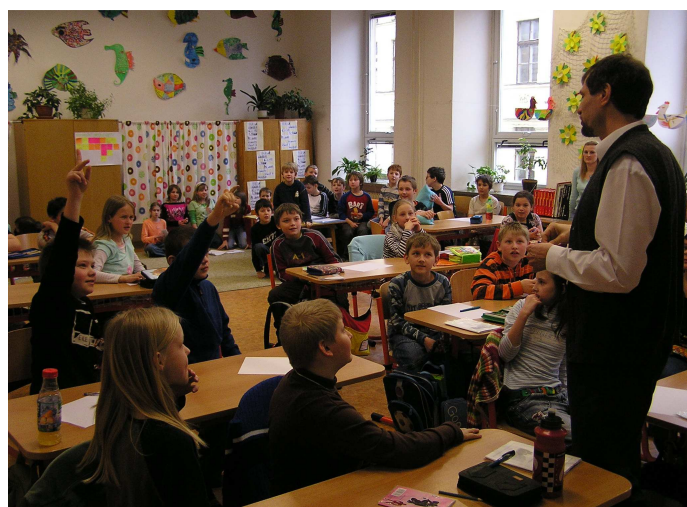
Na základní škole v Příboře

Je nadšená pro službu a stále nás překvapuje tvořivými nápady. Ľubko ji vzácně doplňuje svými kytarovými doprovody, ovládnutím výpočetní techniky, manuální zručností, velkým smyslem pro humor a citlivým přístupem k dětem a mladým lidem. Strávit s nimi předvelikonoční období na školách v Lubině, Mniší, Příboře, Kopřivnici, Šenově, Hodslavicích a Třinci byla pro nás veliká zkušenost. Během 8 dnů se nám z Boží milosti podařilo oslovit evangeliem více než 630 dětí na 7 základních školách. Na některých z nich jsme se setkali s velmi milým přijetím ředitelů a učitelů a modlíme se za to, abychom se na tyto školy směli pravidelně vracet s dalšími programy – kluby dobré naděje nebo jednorázovými slavnostmi. Prosíme, modlete se za to s námi.