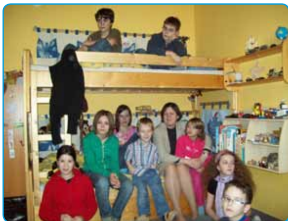
Klub dobré naděje na sídlišti ve Valašském Meziříčí