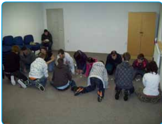
EXIT párty na Salaši