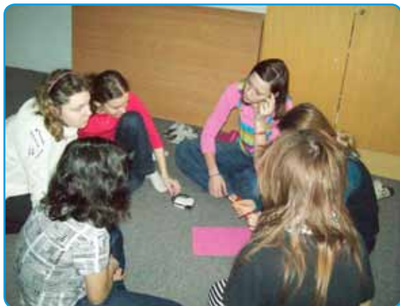
Dívčí pobyt na Salaši