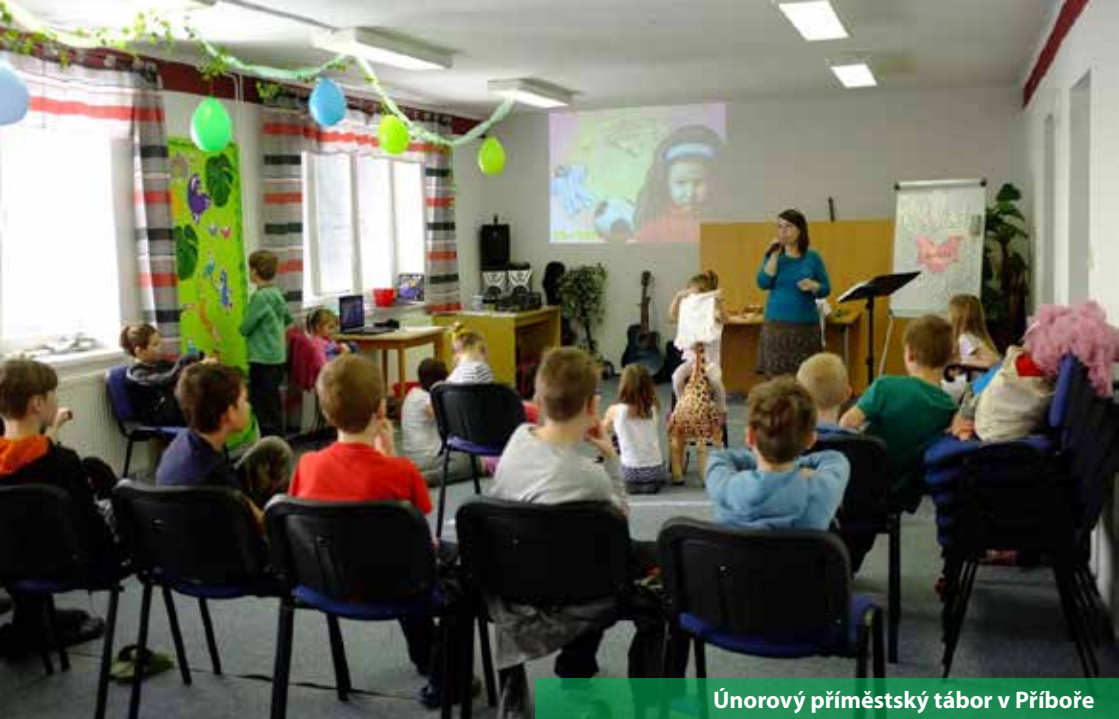
Únorový příměstský tábor v Příboře