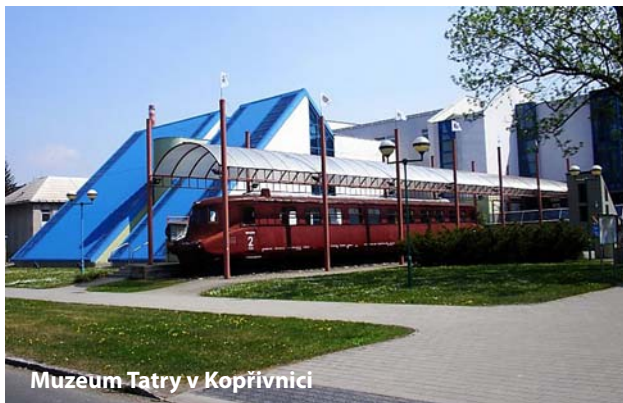
Muzeum Tatry v Kopřivnici

Starý Jičín. Z dřívějšího hradu zde zbyla zřícenina protkaná cestičkami vyšlapanými okolo polo-rozbořených zdí a propadlých sklepení.