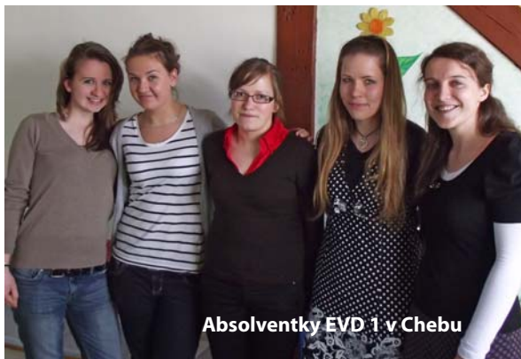
Absolventky EVD 1 v Chebu