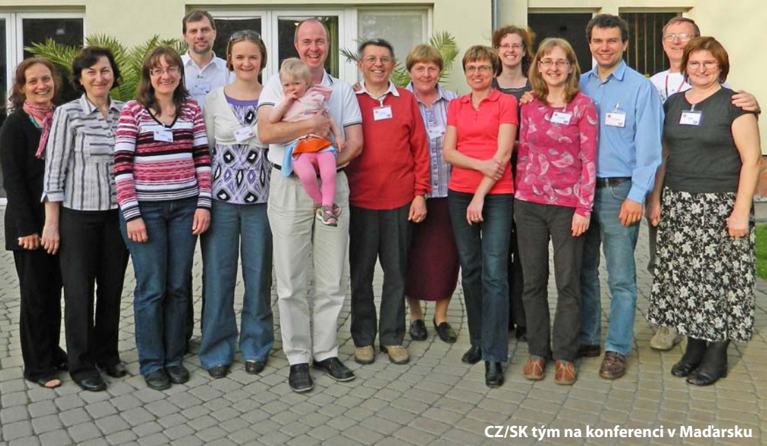
CZ/SK tým na konferenci v Maďarsku