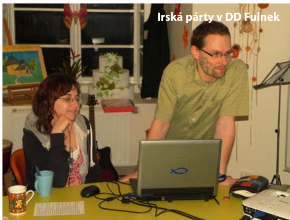
Irská párty v DD Fulnek