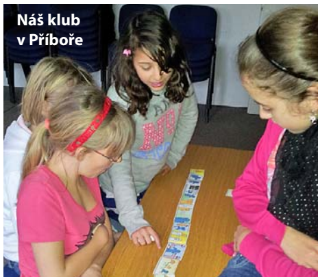
Náš klub v Příboře

během školního roku a že jste se jí mnozí z vás i účastnili svými modlitbami. Na vaši modlitební podporu spoléháme i v době letních prázdnin.