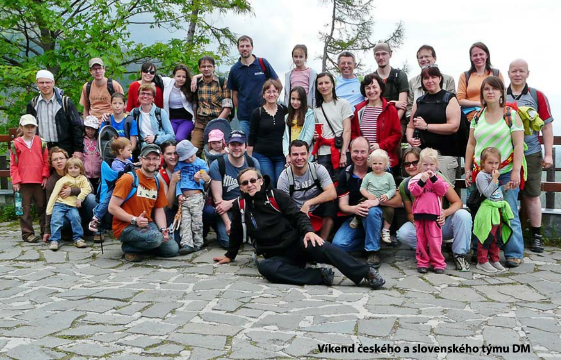
Víkend českého a slovenského týmu DM