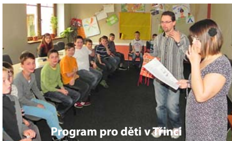
Program pro děti v Třinci

Děkujeme vám, že jste prostřednictvím stránek Zpravodaje sledovali naši službu mezi dětmi