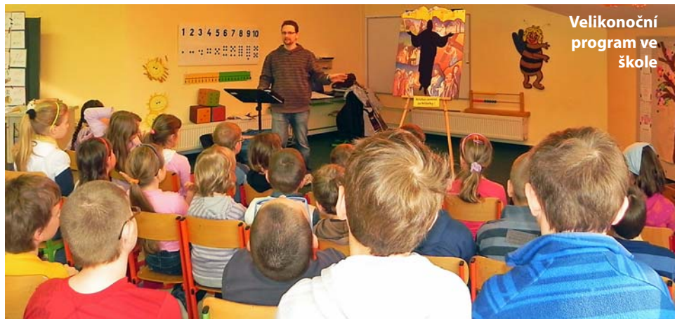
Velikonoční program ve škole