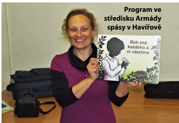
Program ve středisku Armády spásy v Havířově