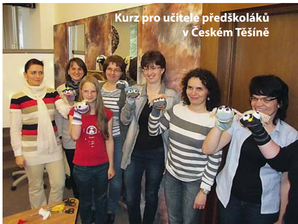
Kurz pro učitele předškoláků v Českém Těšíně