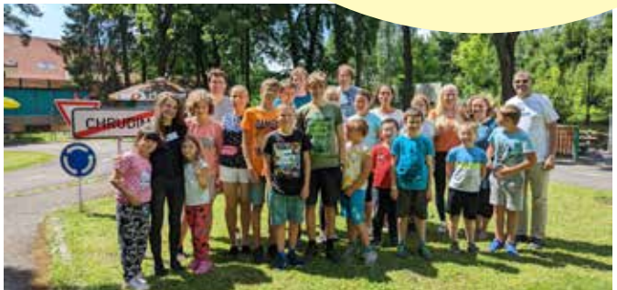
Příměstský tábor Chrudim