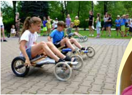
English Camp Třinec