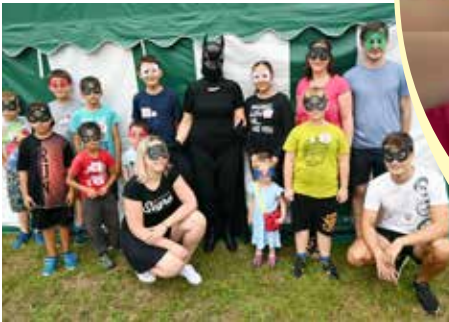
Příměstský tábor Kynšperk nad Ohří