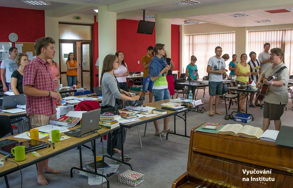
Vyučování na Institutu